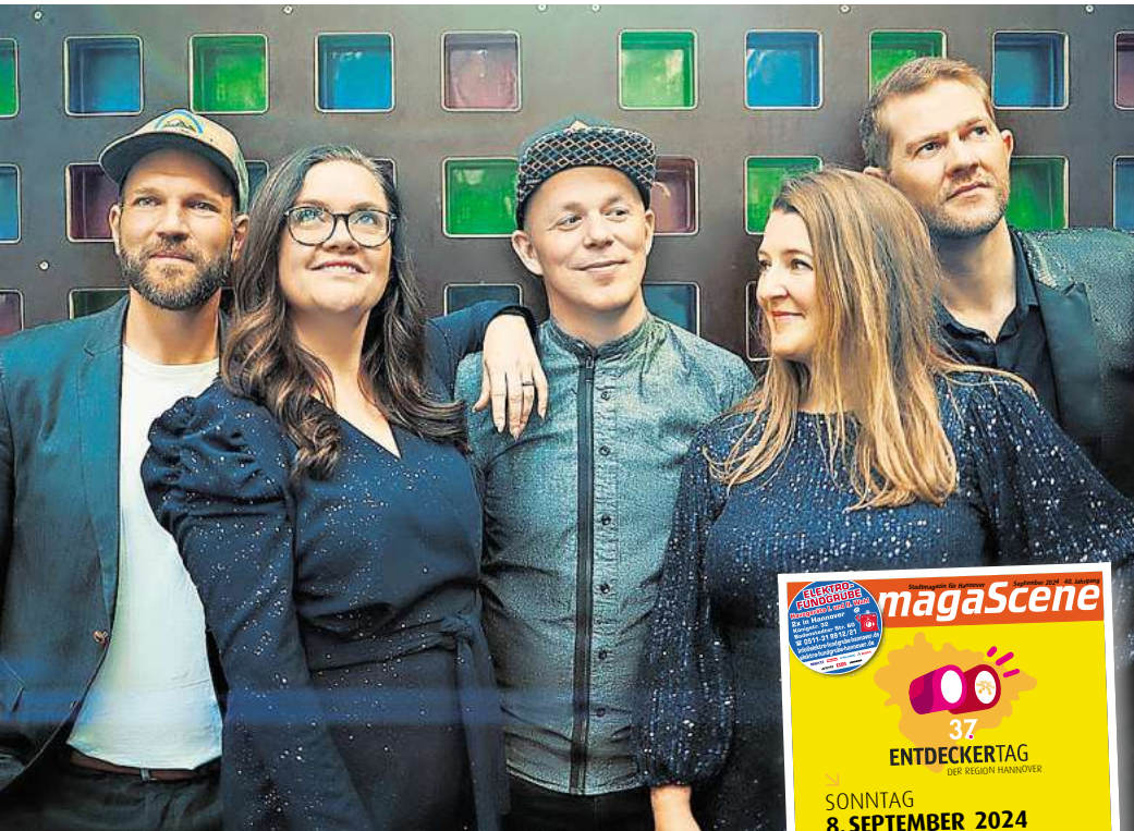
Postyr aus Dänemark – am 26. September im Pavillon

Die preisgekrönte Gruppe Postyr aus Dänemark wird am 26. September im Pavillon zeigen, dass Vokalmusik und Computer ganz hervorragend zusammenpassen. Die Vokal-Band hat mit E-Cappella ein musikalisches Universum erschaffen, eine neue Art von elektronischem Pop, bei dem alles von den Stimmen ausgeht. Durch den Einsatz von Effekten und Computern werden die sanften Stimmen in anregende Beats verwandelt, die mit Chorsounds