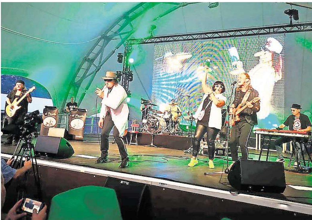
Die Cover-Band „El Paniko und das Katastrophenorchester“ präsentiert am Samstagabend die größten Hits von Udo Lindenberg.