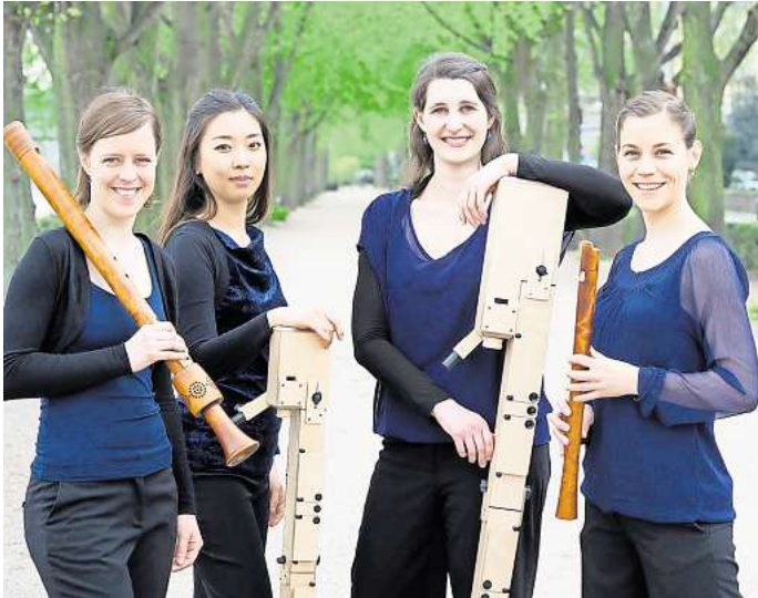
Das Boreas Quartett gastiert am 18. August im Burgdorfer Schloss.

BURGDORF. Vier Spielerinnen, vier Stimmen, vier eigenständige Linien: eine Fuge. In dem außergewöhnlichen Konzertabend am Sonntag, 18. August, um 17 Uhr im Ratssaal des Burgdorfer Schlosses wird sichtbar und hörbar, wie vier Musikerinnen ihren Part verteidigen – ohne das Gesamtwerk aus dem Blick zu verlieren. Der Abend führt durch das reichhaltige Fugen-Repertoire vom 13. Jahrhundert über Poglietti bis Bach und auch in das Hier und Jetzt. Auszüge aus Johann Sebastian Bachs „Kunst der Fuge“ werden kombiniert mit späteren Werken, welche die kompositorischen Möglichkeiten bis in ihre Extreme ausreizen. Da gerät die Welt schon mal „aus den Fugen“. Boreas – der Gott des Nordwindes – gab dem Bremer Blockflöten-Quartett seinen