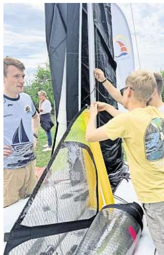
Die Segeljüngend macht die neuen Boote startklar.

und Jugendliche ab neun Jahren frei. Anfragen sind möglich, per E-Mail an jugend@ssv-segeln.de oder über den Ferienpass der Stadtjugendpflege Burgdorf unter unser-ferienprogramm.de/burgdorf .