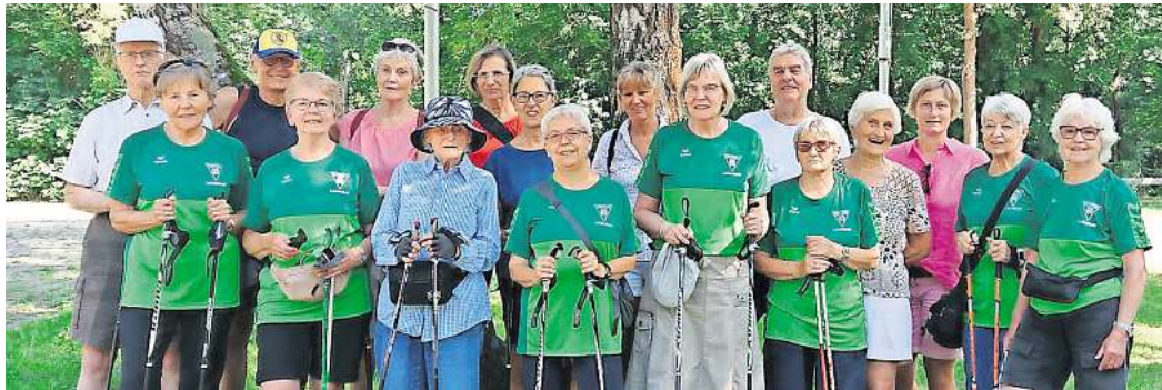
Die Nordic-Walking-Gruppe der TSV-Leichtathletiksparte ist zu ihrem 20-jährigen Bestehen bei sommerlicher Hitze gemeinsam auf Tour gegangen.

Nordic-Walking-Gruppe der TSV-Leichtathletiksparte feiert Geburtstag