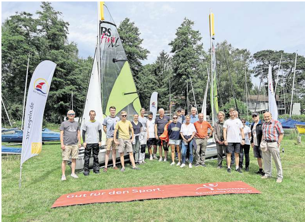
Die Mitglieder der Segelsparte freuen sich über die neuen Jugendjollen.

Sportboote sollen die Lücke zwischen dem Einsteigerbereich und dem Yachtsegeln schließen