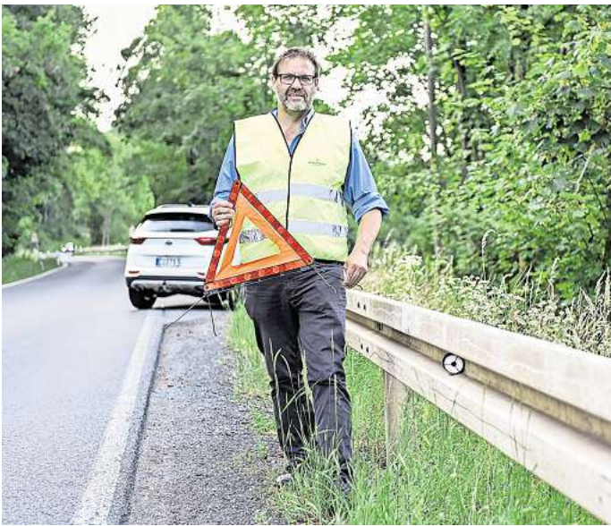
Was ist bei einem Unfall im Ausland zu tun?

Nicht allein in diesem Punkt unterscheidet sich die Schadenregulierung der einzelnen Länder. Sobald es im Ausland kracht, gilt