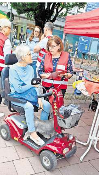
SoVD-Mitglieder sprechen vor dem Burgdorfer Rathaus an der Marktstraße mit Passanten über das Thema Pflege.