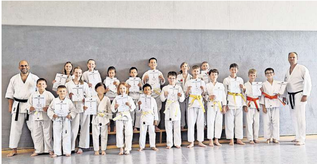
Teilnehmer der Karate Kinder-Prüfung im Verein Samurai Burgdorf.