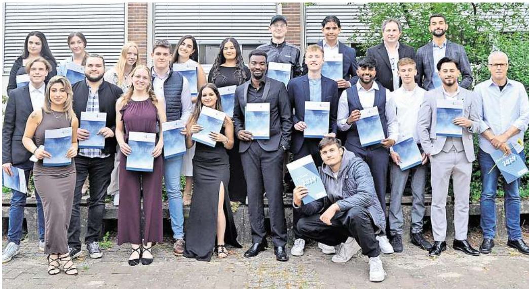
Die erfolgreichen Absolventen der Fachoberschulen Technik und Wirtschaft der BBS Burgdorf.