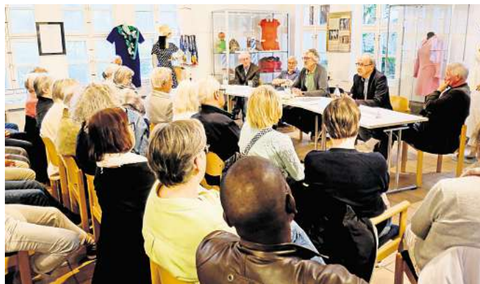
Beim Erzählcafé im Stadtmuseum schildern Zeitzeugen persönliche Erlebnisse aus den Sechzigerjahren.

Zeitzeugen haben von persönlichen Erlebnissen berichtet / Ausstellung läuft bis zum 4. August