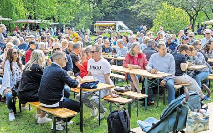
Viele Besucher genießen am Himmelfahrtstag das schöne Wetter und die entspannte Stimmung bei „Musik und Tanz im Stadtpark“.

ren bekannt war, da er jahrelang mit der Band „Nerbas & Nerbas“ bei der Traditionsveranstaltung im Stadtpark aufgetreten ist. Außerdem bot die Burgdorfer Tanzschule Studio B5 ein kurzwelliges Mitmachprogramm an und es gab vielfältige Aktionen für Kinder. Gemeinsame Gastgeber waren der Verkehrs- und Verschönerungsverein (VVV), der Marktspiegel, das Studio B5 und der Fitnesspark Burgdorf.