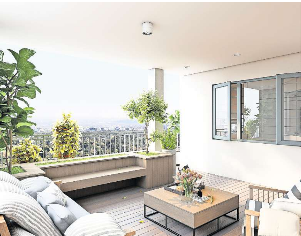
Möbel auf Maß sparen Platz und sehen perfekt integriert aus.

Balkone und Terrassen weisen einen begrenzten Platz auf und sollen einladend und gemütlich wirken. Insbesondere große Familien benötigen zudem ausreichend Platz, um entspannt zusammensitzen zu können. Balkon- und Terrassenmöbel gibt es in Hülle und Fülle, aber nicht jeder Grundriss ist für Fertigmöbel geeignet. Besonders Balkone müssen manchmal mit etwas Raffinesse eingerichtet werden, damit jeder Platz genutzt werden kann. Eine attraktive Alternative zu Fertigmöbeln sind Möbel auf Maß. Egal ob Tische, Stühle, Gartenmöbel, Sitzgruppen, Hocker, Rund-, Garten- oder Eckbänke: Jedes Möbelstück lässt sich auf Maß anfertigen. Auf diese Weise erhält man platzsparendes, hochwertiges und zeitloses Mobiliar für seinen Außenbereich. Spezielle Fachfirmen nehmen sich dem Aufmaß, der Planung und dem Bau der Maßmöbel an. Zunächst schaut sich ein Mitarbeiter den Balkon oder die Terrasse genau an. Er