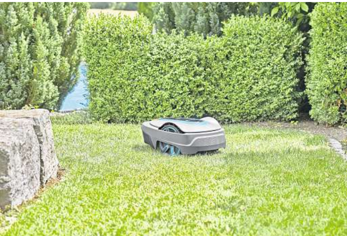
Mit einem Mähroboter kann man den Rasen mühelos kurzhalten.

Ein Rasen- oder Mähroboter hat viele Vorteile. Der größte liegt auf der Hand: Er läuft voll automatisch und nimmt einem damit jede Menge Arbeit ab. Wer darauf achtet den Rasen kurz zu halten, sorgt für einen dichteren Wuchs und macht es Unkraut schwerer, die Oberfläche zu gewinnen. Die abgetrennten Halme verbleiben als Mulch auf der Fläche und fungieren als Dünger. Besonders Allergiker profitieren, da sie nicht mehr direkt mit dem Schnittgut in Kontakt geraten. Außerdem sind Mähroboter wesentlich leiser als elektrisch oder mit Benzin betriebene Geräte. Weist das Grundstück viele Höhenunter-