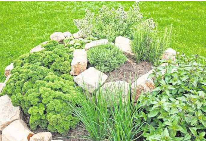
Eine Kräuterspirale bietet optimale Wachstumsbedingungen für unterschiedliche Kräuter.

Eine Kräuterspirale im Garten ist nicht nur eine Augenweide, sie dient außerdem dazu, verschiedenen Kräutern die optimalen Wachstumsbedingungen zu ermöglichen. Einem Schneckenhaus ähnlich türmt sie sich im Garten auf und beheimatet platzsparend Kräuter mit unterschiedlichen Standortansprüchen. Aufgrund des typischen Aufbaus der Kräuterspirale beziehungsweise Kräuterschnecke werden mehrere Klima- und Feuchtigkeitszonen simuliert. Die Baumärkte und der Gartenfachhandel halten Bausätze für Kräuterspiralen aus verschiedenen Materialien mit dem