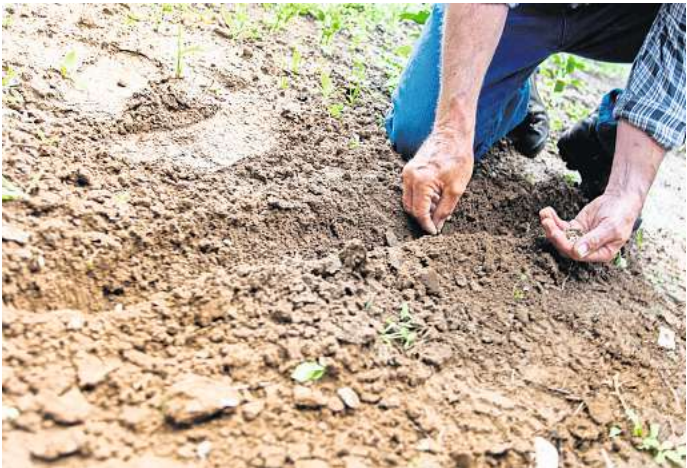
Trotz kühler Temperaturen können im März schon die ersten Samen in die Erde.