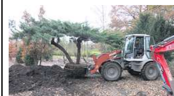
Die Baumschule Beensen's Gärten sorgt für wirkungsvolle Solitärgehölze im Garten.

Wer sich also für ein einzelnes wirkungsvolles Solitärgehölz für seinen Garten interessiert, wer seinen Garten neu gestalten lassen möchte oder Gartenbereiche verändern will, findet in Rüdiger Beensen einen engagierten Ansprechpartner und ist herzlich zu einem Besuch der Baumschule eingeladen. Um eine individuelle Beratung zu gewährleisten, wird zuvor um Terminabsprache gebeten.