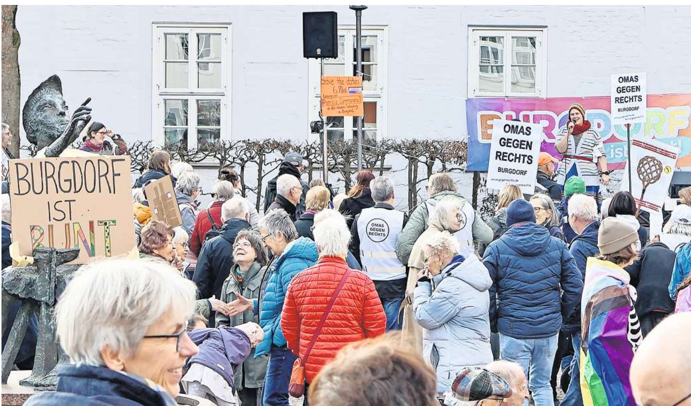
250 Menschen haben auf dem Spittaplatz gegen Rechts demonstriert.

Bei diesem Mal sollte es nicht mehr nur darum gehen, ein Zeichen gegen rechtsextreme Tendenzen in der Gesellschaft zu setzen. Stattdessen setzten sich die Veranstalterinnen gezielt mit dem Thema der sogenannten Care-Arbeit auseinander, der Fürsorge und Pflege, sowie den Frauen- und Familienbildern der