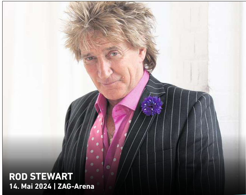
ROD STEWART 14. Mai 2024 | ZAG-Arena

Falls Sie dieses Produkt nicht mehr erhalten möchten, bitten wir Sie, einen Werberverbandsauflöser mit dem Zusatzhinweis « bitte keine kostenlosen Zeitungen » an Ihrem Briefkasten anzubringen. Weitere Informationen finden Sie auf dem Verbraucherportal www.werbung-im-Briefkasten.de .