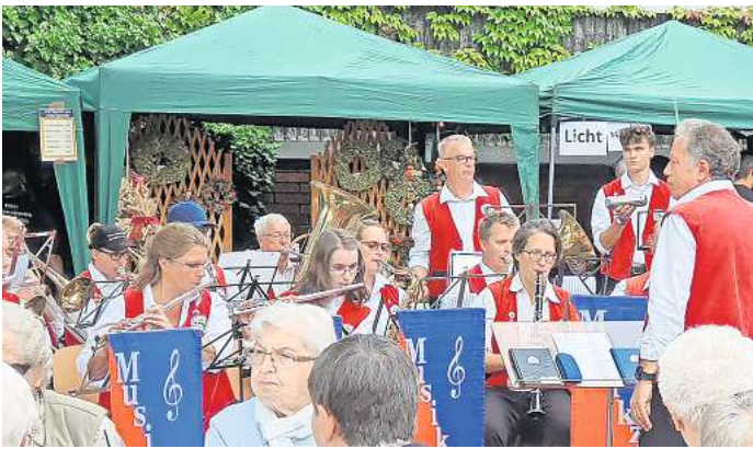
Beim Pappaulfest hat zur Eröffnung der Feuerwehrmusikzug Burgdorf-Hänigsen gespielt.