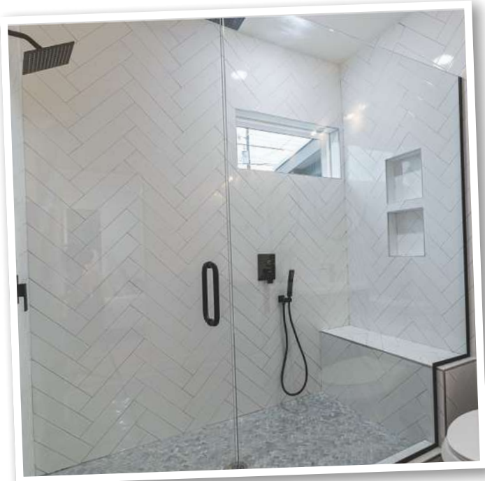
Eine Kingsize-Dusche bietet genügend Raum zum Abseifen und Abspülen.