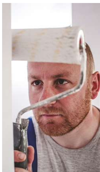
Naturfarben sind gesundheitlich unbedenklich.