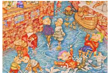
1. Platz: Uwe Schneider (Langenhagen) 16,9 Prozent