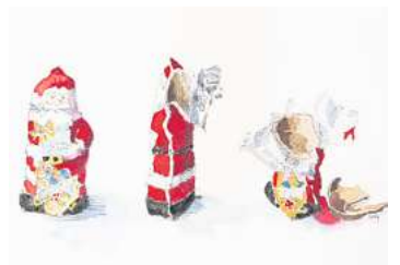
3. Platz: Merle Queisner (Hannover) 11,2