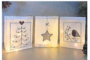
2. Platz: Christiane Neuber-Neiweiser (Hannover) 15,8