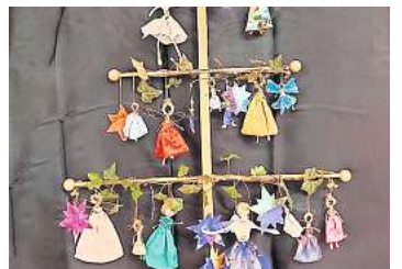
3. Platz: Ursula Mülleck (Hannover) 10,2