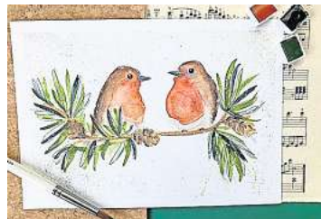
2. Platz: Sophie Hoffmann (Hannover) 13,5