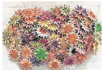
1. Platz: Andrea Krimling (Hagenburg) 8,2 Prozent