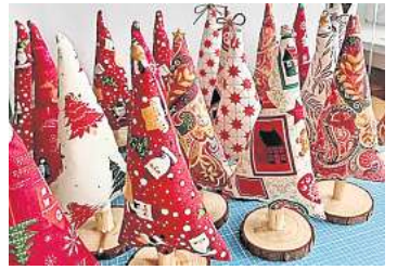
1. Platz: Laura Eicke (Hemmingen) 23,1 Prozent