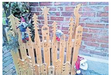
2. Platz: Angelika Mensing (Lehrte) 7,3