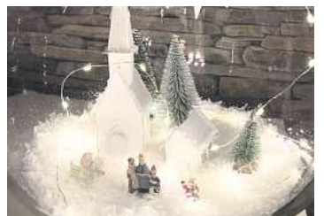
3. Platz: Johanna Wutschke (Garbsen) 4,3