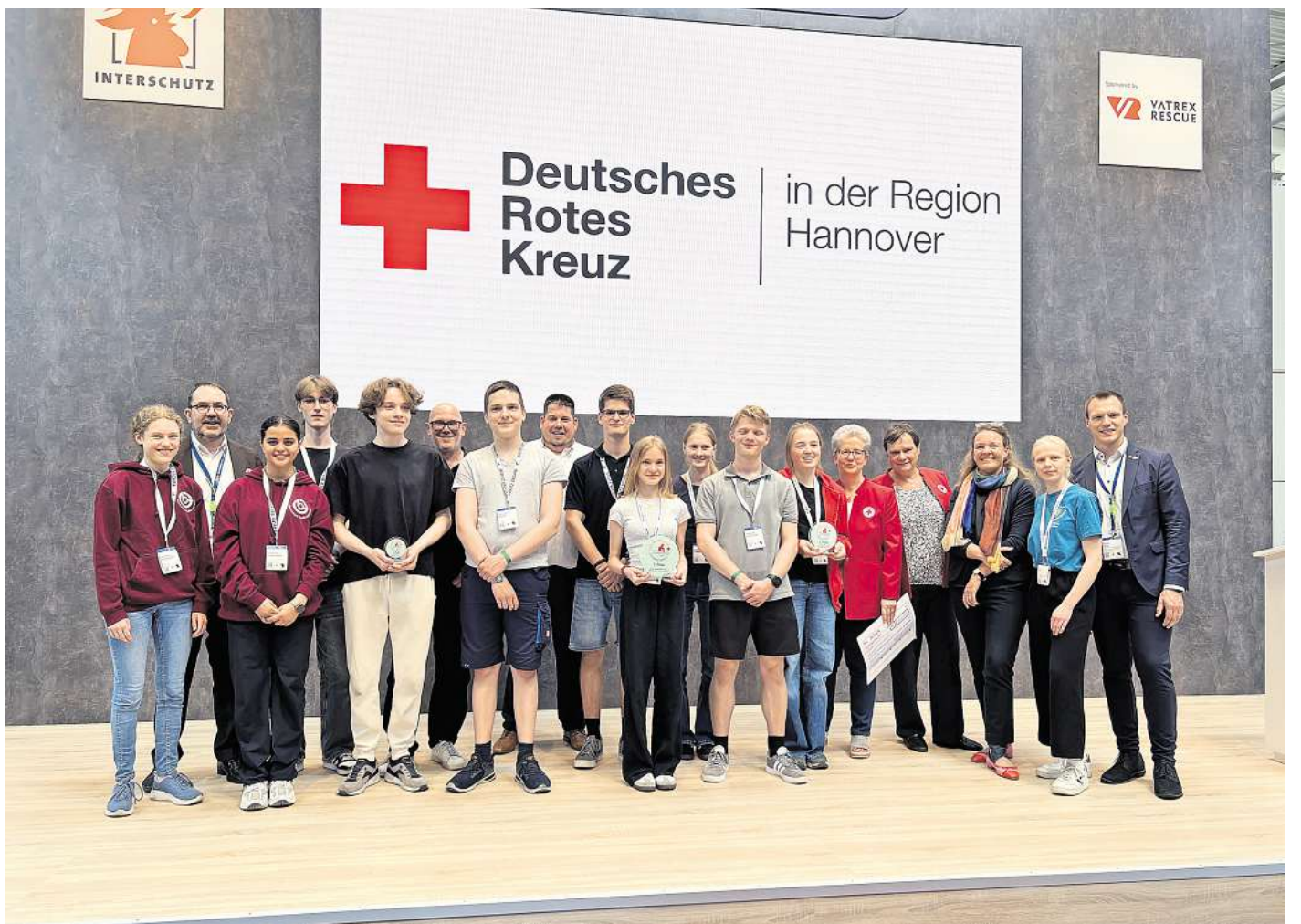
Beim Schulsanitätsdienst-Wettbewerb auf der Interschutz belegten zwei Teams aus Großburgwedel Spitzenplätze: Das Gymnasium gewann, die IGS wurde Dritter.

Insgesamt nahmen 310 Schülerinnen und Schüler aus 23 Schulen an dem Wettbewerb teil.