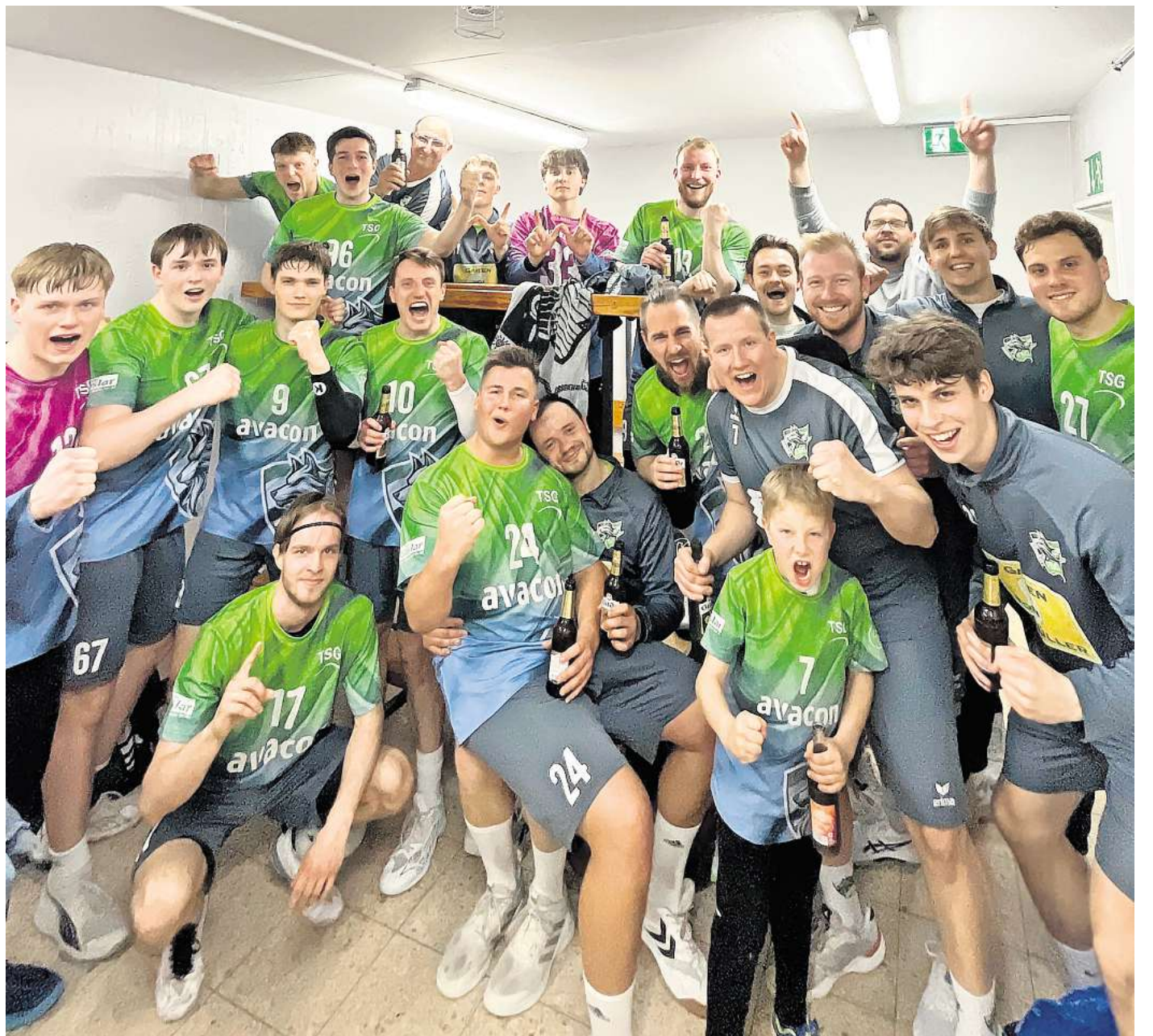
Großer Jubel: Mit dem Sieg über den TuS Altwarmbüchen sicherte sich die 1. Herren der TSG den dritten Platz in der Regionsoberliga.

Die Handballer der TSG bedanken sich herzlich bei allen Zuschauern, Sponsoren und Förderern für die großartige Unterstützung während der gesamten Saison und freuen sich bereits jetzt auf die kommende Spielzeit.