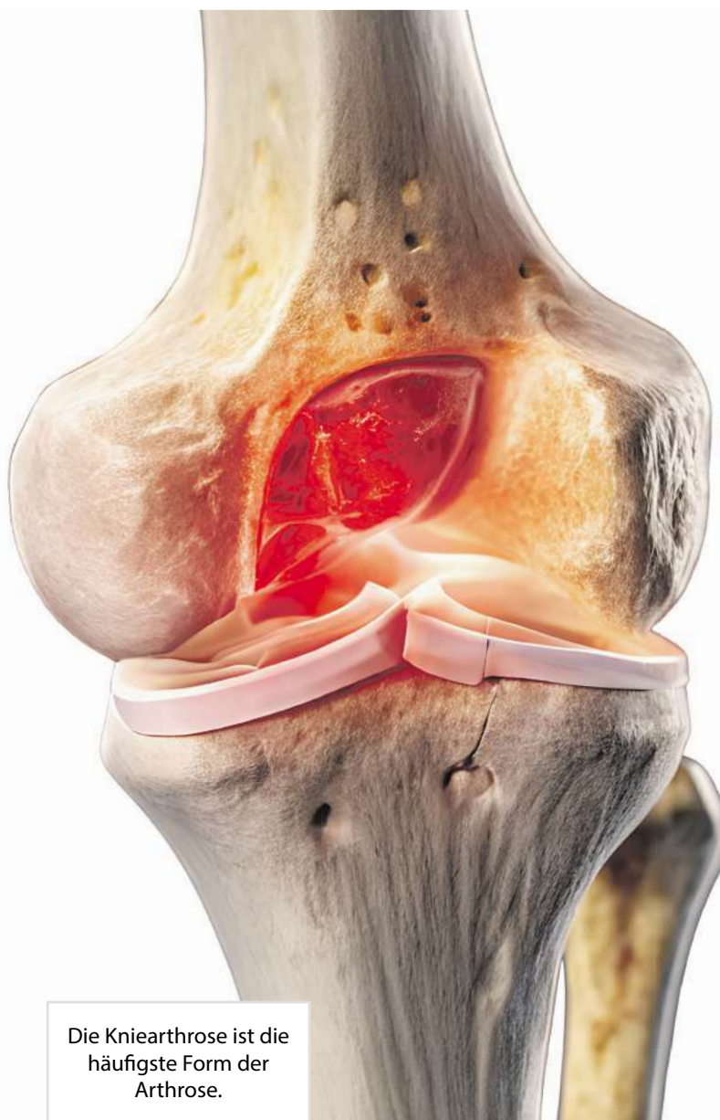
Die Kniearthrose ist die häufigste Form der Arthrose.

Ein typisches Zeichen ist der „Anlaufschmerz“. Dabei verspüren Betroffene beim Loslaufen auf den ersten Metern ein Ziehen, z. B. in der Hüfte oder im Knie. Arthrose beginnt außerdem in vielen Fällen damit, dass sich die Gelenke steif anfühlen oder anschwellen. Später kommt häufig ein Belastungsschmerz hinzu.