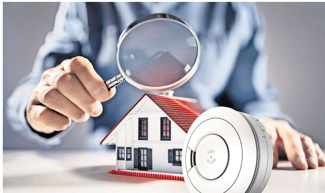
Woran erkennt man einen guten Rauchmelder, der zuverlässig im Brandfall warmt und benutzerfreundlich in der Bedienung ist?

Brandschutzexperten empfehlen Geräte mit fest eingebauter 10-Jahres-Lithium-Batterie. Sie gewährleisten über die gesamte Lebensdauer eine sichere Stromversorgung. Nach Ablauf von zehn Jahren müssen die Melder ohnehin ausgetauscht werden. Bei Modellen mit wechselbaren Batterien gilt es hingegen selbst sicherzustellen, dass diese regelmäßig rechtzeitig erneuert werden. Andernfalls riskiert man, dass der Melder nicht funktionsbereit ist oder durch ein Piepen auf die schwache Leistung der Batterie aufmerksam macht. Und fängt ein Rauchmelder an zu piepen, obwohl es nicht brennt, ist das ärgerlich – gerade nachts. Deshalb lohnt sich auch ein Blick auf die Verpackung. Dort sollte ein mit Flammen gefülltes „Q“ zu finden sein – ein Qualitätssiegel, das unter anderem einen besonders guten Fehlalarmschutz bescheinigt. Naheliegender ist, sich bei der Auswahl