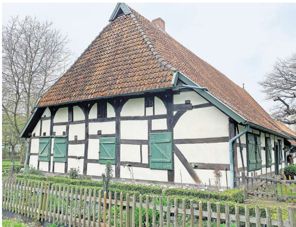
Saisonstart im Bauernhausmuseum: Seit Anfang Mai öffnet der Wöhler-Dusche-Hof wieder sein Tor.

Bänke für die Besucher aufstellen, Kuchen backen, am Tresen Kaffee und Kuchen anbieten, die Spülmaschine ein- und ausräumen, Getränkeketten schleppen: All das und vieles mehr sei für die meisten älteren Aktiven nicht mehr zu bewältigen. Was das zur Folge hat, erläutert Schaumann anhand eines Beispiels: Hätten früher ehrenamtliche Helfer kaputte Bretter ausgetauscht, komme heute der Tischler – und danach die Rechnung. Mittlerweile beschäftigt der Verein auch eine Gärtnerin auf Minijob-Basis. „Wir benötigen dringend neue Helferinnen und Helfer“, wirbt