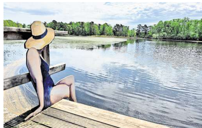
Aktuell hat der Wurmsee wieder einen relativ hohen Wasserspiegel. Der Rundweg mit acht Kunst-Stationen ist einen Spaziergang wert!

Zunächst läuft der Pachtvertrag bis Oktober, danach wird man sehen. Auf jeden Fall ist geplant, das umliegende Gelände nach Jahren des Brachliegens ganz allmählich wieder zu einem Ausflugsziel mit ganz besonderem Charme zu machen. Übrigens: Wenn es das Wetter zulässt und noch genügend Gäste da sind, dann kann sich Rainer Einwald vorstellen, sein kleines Gastro-Häuschen auch nach 18 Uhr noch geöffnet zu halten.