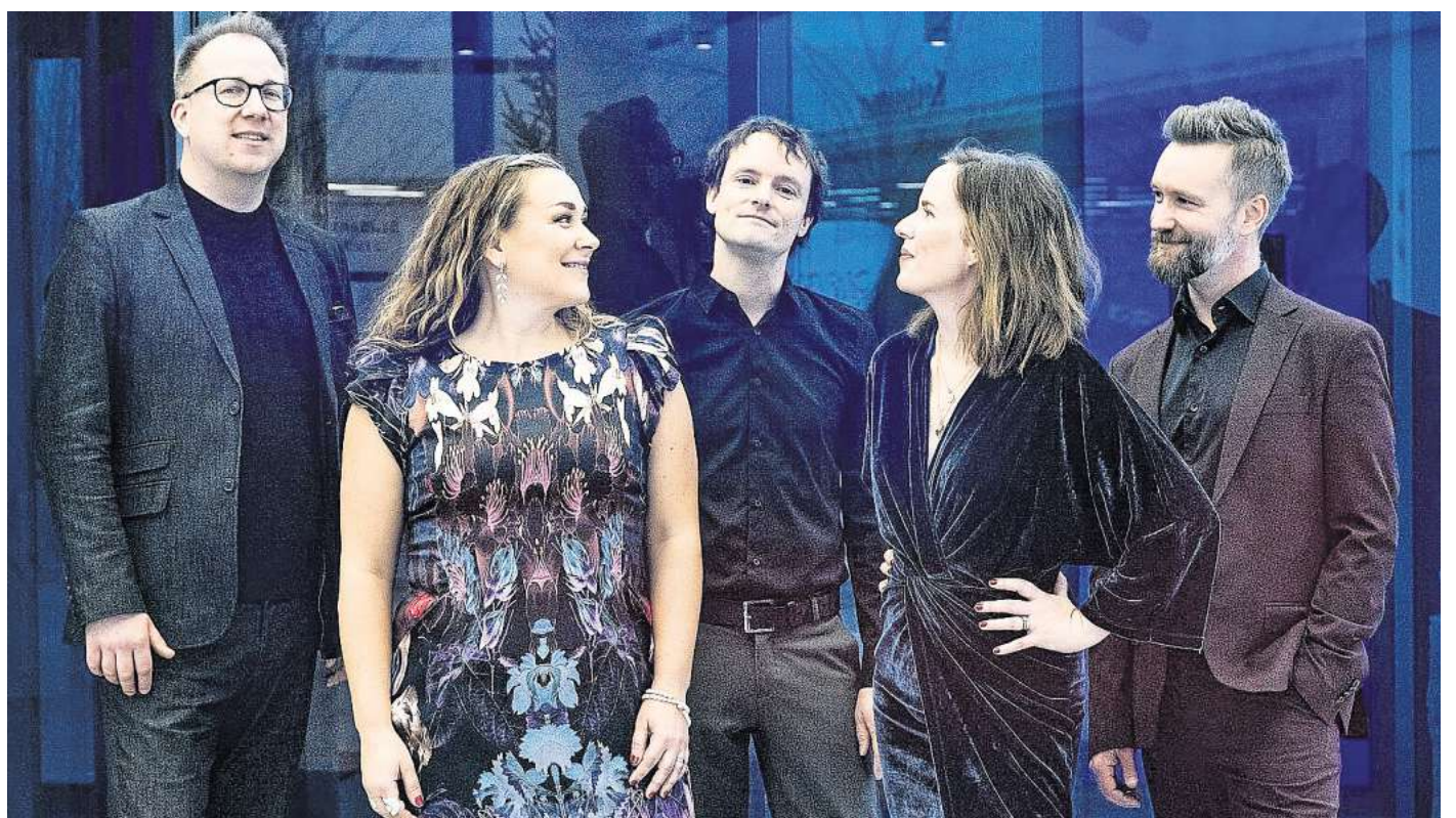
Das schwedische Vokalensemble Vocado tritt in Burgdorf auf.

In diesem Jahr treten vom 25. April bis 3. Mai insgesamt neun Ensembles aus sieben Ländern in der Region Hannover auf. Als Rahmenprogramm werden wieder Workshops und der beliebte A-cappella-Singtreff angeboten.