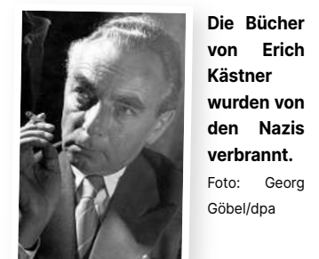
Die Bücher von Erich Kästner wurden von den Nazis verbrannt.

Die Paulus-Feierabendakademie widmet sich am Mittwoch, 15. April, dem Schriftsteller Erich Kästner. Der Vortrag beginnt um 19 Uhr im Kirchenzentrum, Berliner Ring 17. Der Eintritt ist frei, Spenden sind willkommen. In der Pause gibt es eine Suppe.