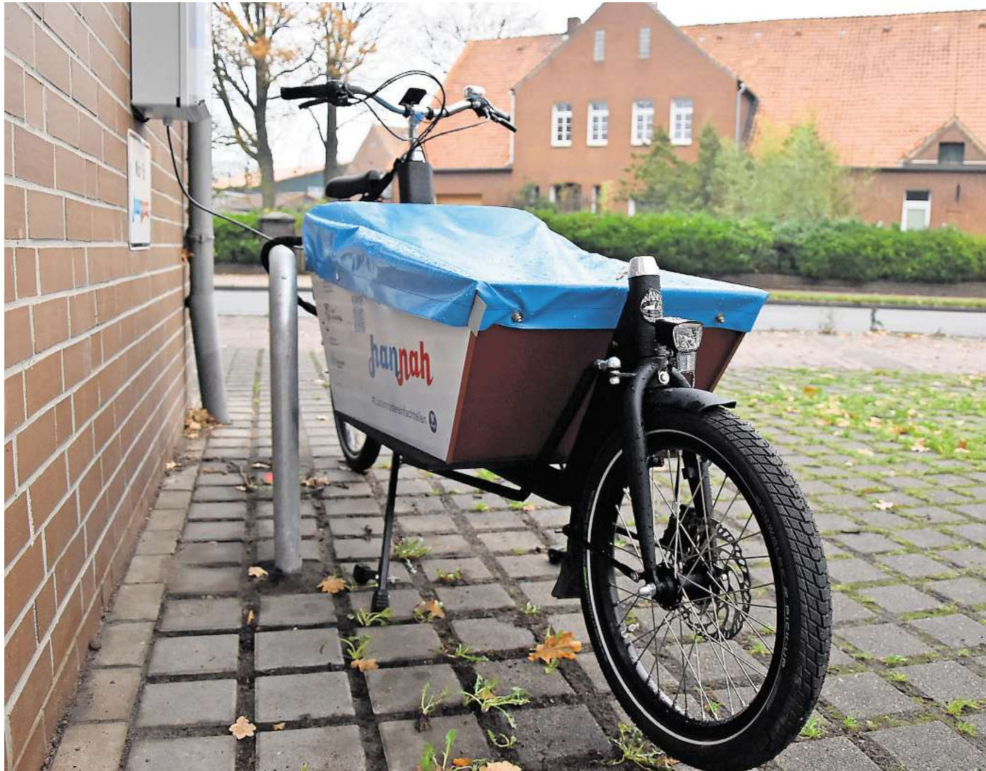
Das Training für das Lastenrad Hannah in Kleinburgwedel findet am ehemaligen Feuerwehrhaus statt.

Aktuelle Informationen und mögliche Terminänderungen veröffentlicht der ADFC auf seiner Website sowie über die Plattform StadtLandFunk.