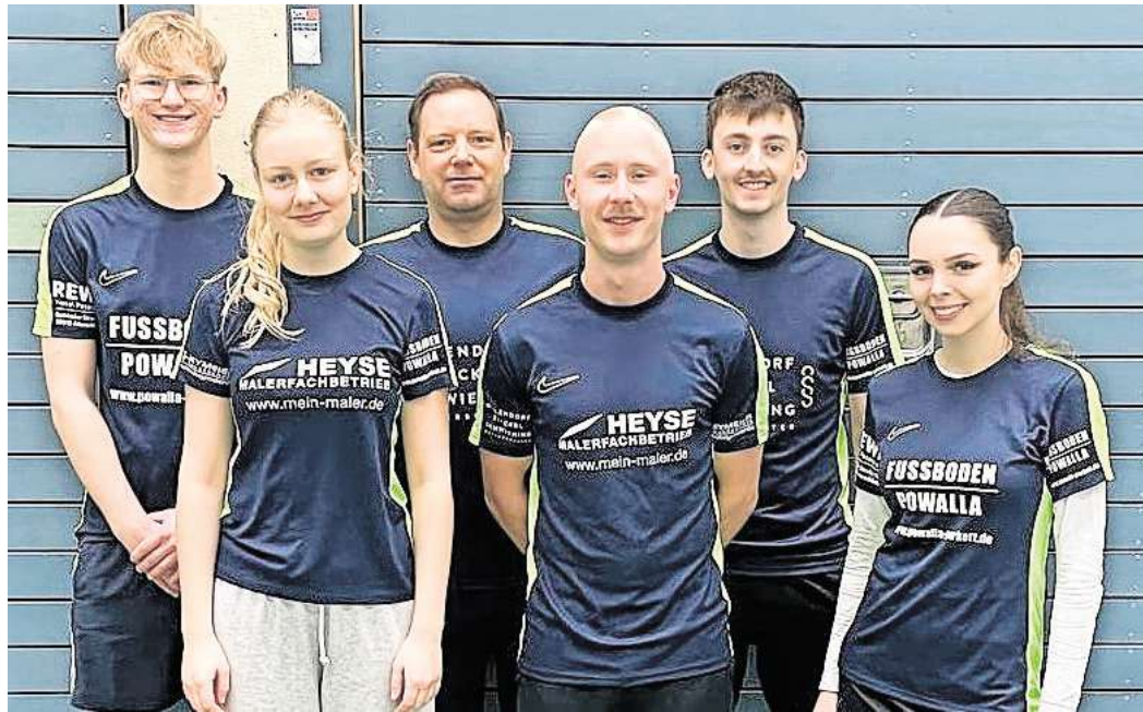
Mit Teamgeist, Humor und sportlicher Qualität geht es für die 2. Mannschaft nun eine Liga höher in die Bezirksklasse.

ALTWARMBÜCHEN (r/bs). Die zweite Mannschaft des Altwarmbüchener BC hat sich mit einem erfolgreichen Saisonfinale den Aufstieg in die Bezirksklasse gesichert. Zwei klare Siege waren notwendig, um das Ziel zu erreichen – und das Team lieferte.