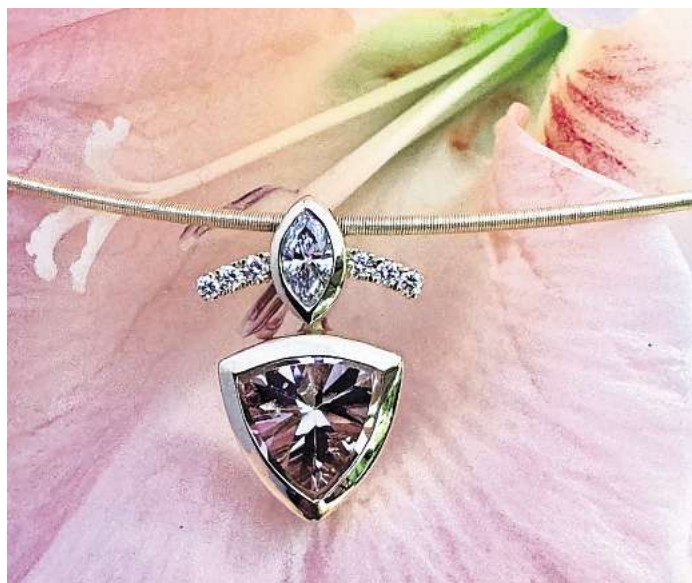
Wer das Besondere schätzt, wird an diesen Tagen im Isernhagenhof sicherlich fündig.

Der Kunsthandwerkmarkt im Isernhagenhof, Hauptstraße 68B, in Isernhagen ist am Sonnabend, 21. März, von 13 bis 18 Uhr sowie am Sonntag, 22. März, von 11 bis 17 Uhr geöffnet. Der Eintritt kostet 4 Euro, Kinder bis 14 Jahren haben freien Eintritt. Für gastronomische Angebote ist ebenfalls gesorgt.