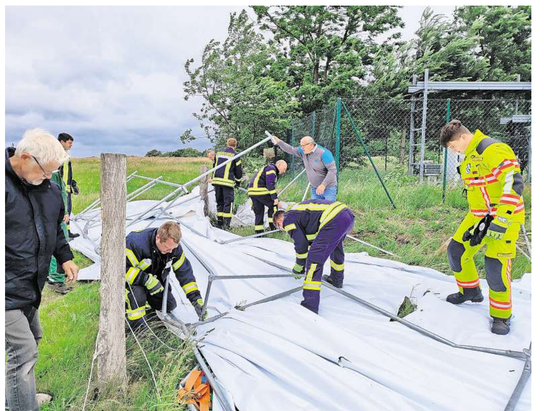
Ein Sturm am Pfingstmontag sorgte für dramatische Szenen: Zelte und Grillstand wurden von heftigen Böen mehr als 150 Meter weit geweht und konnten nur mit Hilfe der Feuerwehr geborgen werden.