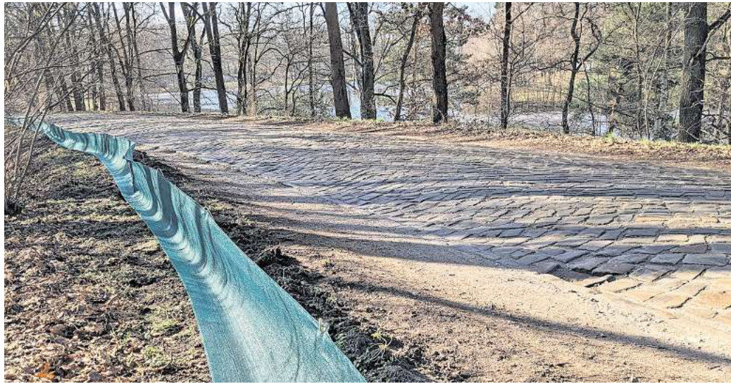
Am Parksee Lohne wurde ein weiterer Schutzzaun mit einer Länge von etwa 400 Metern errichtet.

Entlang des Schmiededamms im Bereich des Mausoleums besteht seit Jahren ein rund 150 Meter langer Amphibienschutzzaun. Ergänzend wurde erstmals am Parksee Lohne ein weiterer Schutzzaun mit einer Länge von etwa 400 Metern errichtet. Ziel ist es, die Tiere noch umfassender vor dem Überfahren durch Kraftfahrzeuge zu bewahren. Aufgrund der erweiterten Schutzmaßnahmen wird auf eine nächtliche Sperrung