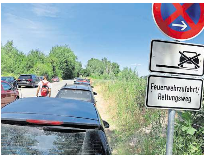
Parken am Hufeisensee in H.B.