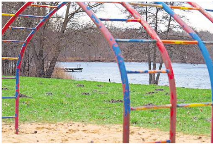
Aufwertung: Der Kirchhorster See soll attraktiver werden.

Der Kirchhorster See ist ein beliebter Badesee in der Region Hannover. Mit Badesteg, Liegewiese und kleinem Spielplatz bietet er schon jetzt einiges für den Freizeitspaß. Mit öffentlichen Verkehrsmitteln ist er gut zu erreichen. Das hohe Algenaufkommen der vergangenen Jahre hat die Gemeinde mit einer regelmäßigen Mahd inzwischen weitgehend in den Griff bekommen. Doch der See bietet noch deutlich mehr Potenzial als Ausflugsziel für Familien, ist sich die Gemeinde sicher, und will ihn daher nun für das LEADER-Programm anmelden.