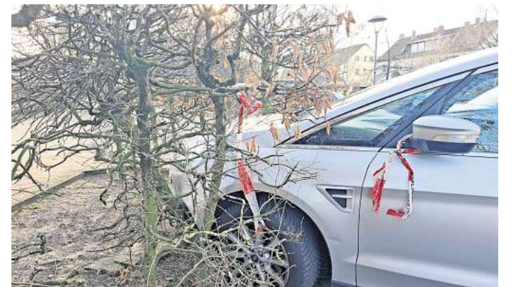
Der zweite Unfall: Der Ford steht mit der Front in einer Hecke.

sacht. Doch bei dem einen Unfall blieb es nicht. Für die Unfallaufnahme und die Bergung des Polo durch einen Abschleppwagen sollte der Senior seinen Wagen einige Meter vorwärts in eine Parklücke fahren. Die Polizei darf dieses nach Angaben einer Sprecherin nicht einfach selbst tun. Lag es an der Aufregung? Der