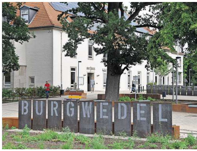
Rathaus Burgwedel in Großburgwedel