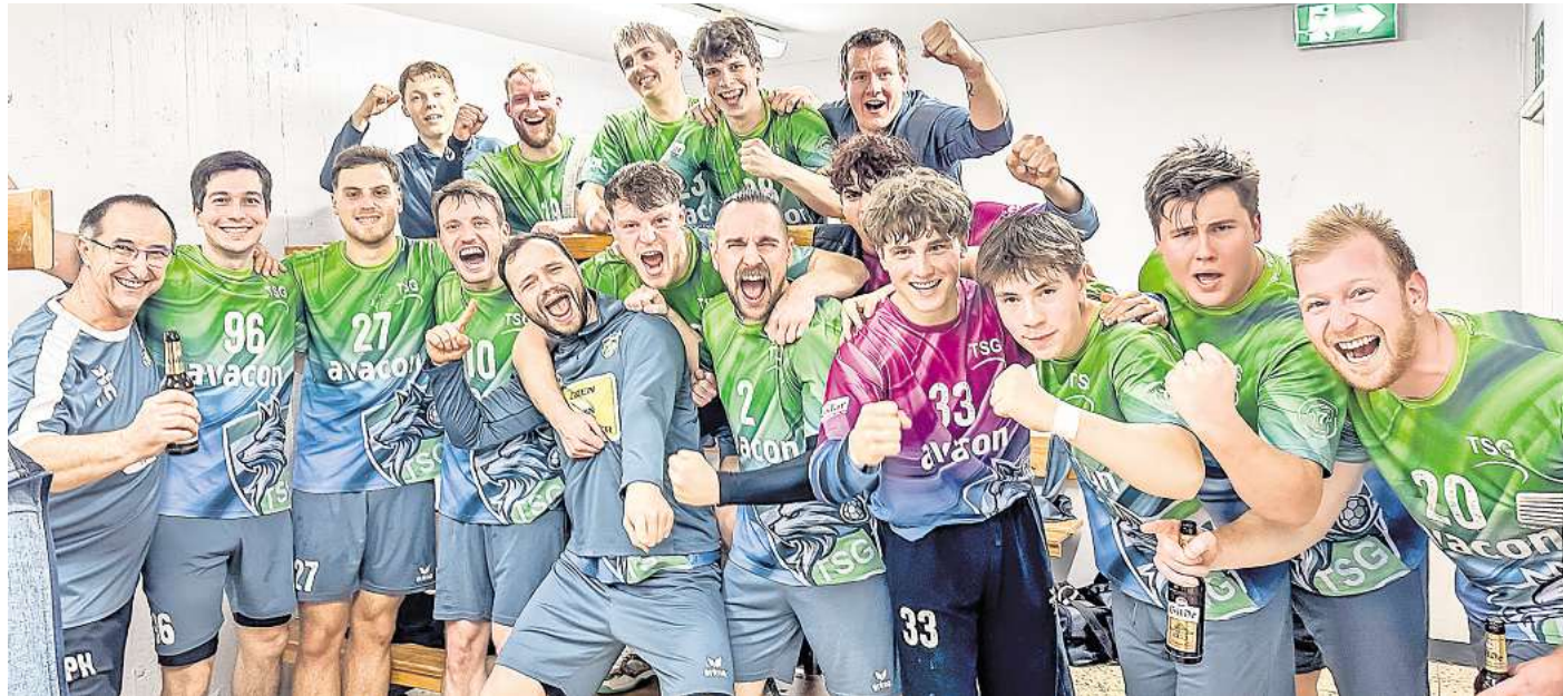
Die erste Herren feiert den verdienten Heimsieg im letzten Spiel des Jahres 2025 gegen den DJK Hildesheim.

Handballherren der TSG mit Licht und Schatten