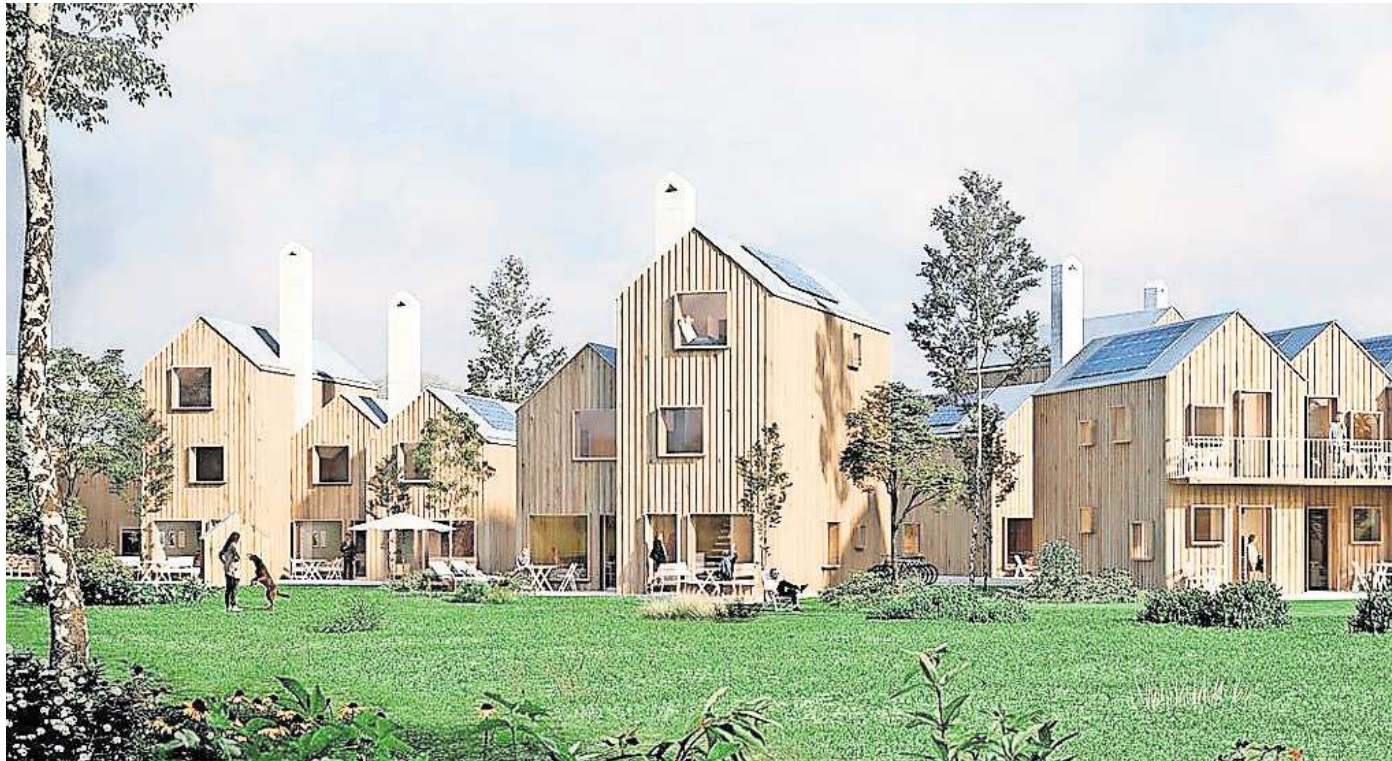
Rossmann plant Ökosiedlung für Burgwedel: So soll das geplante Wohnquartier Am Mühlenfeld einmal aussehen.

Fest steht hingegen, was auf der 15.000 Quadratmeter großen Fläche realisiert werden soll: Die angepasste Planung der Rossmann-Immobiliengruppe sieht nun 80 Wohneinheiten vor. Zunächst war von 70 Wohnein-