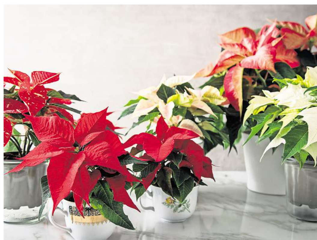
Der Weihnachtsstern ist ein Klassiker in der Adventszeit und bringt mit seinen farbigen Hochblättern natürliche Farbakzente ins Wohnzimmer.