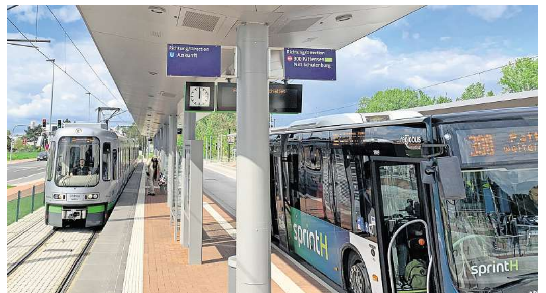
Im öffentlichen Nahverkehr gelten an Heiligabend, den Weihnachtsfeiertagen, Silvester und Neujahr Sonderfahrpläne.

In der Nacht auf den ersten Weihnachtsfeiertag gibt es keinen Nachtsternverkehr. In der Nacht auf den zweiten Weihnachtsfeiertag wird der Nachtsternverkehr wie von Sonntagen nach dem Samstagsfahrplan. In der Silvesternacht wird ein Nachtsternverkehr angeboten. Ab etwa 0.45 Uhr erfolgen Sonderfahrten. Der sprinti bedient am 31. Dezember wie an einem Werktag, also ab 5.30 Uhr beziehungsweise in Sehnde ab 5 Uhr, inklusive des Nacht-