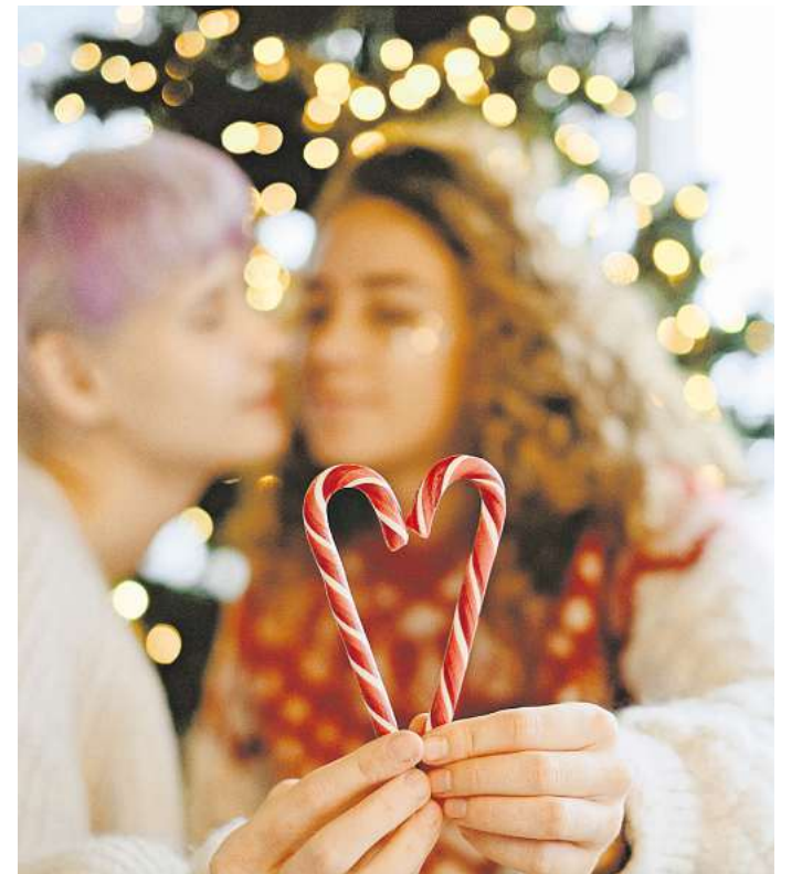
Wahlfamilie: Zum Fest der Liebe dürfen neue Familientraditionen etabliert werden.

Feiern mit der Wahlfamilie bedeutet oft, Traditionen zu ersetzen oder neue zu erfinden. Es bedeutet, einen Tisch zu decken, an dem Menschen sitzen, weil sie sich füreinander entschieden haben. Und vielleicht ist genau das die schönste Art, Weihnachten zu feiern: mit einem Kreis, der nicht durch Zufall oder ausschließlich durch genetische Abstammung entstanden ist, sondern durch gegenseitige Wärme, Respekt und das stille Wissen, dass Liebe viele Formen haben darf.