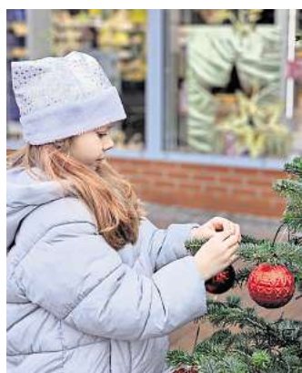
Mit roten Kugeln und Holzanhängern schmückten die Kinder die Weihnachtsbäume in der Von-Alten-Straße.

Großburgwedeler Kaufleute (IGK) teil – ein starkes Zeichen für Zusammenhalt und Engagement. Nach getaner Arbeit kehrten die Gruppen zum Treffpunkt zurück, wo alle Beteiligten mit Keksen, Lebkuchen und warmen Getränken empfangen wurden. Zum Abschluss erhielt jedes Kind ein kleines Geschenk. Die Aktion stieß auf große Freude und viel Lob seitens der Teilnehmenden und Passanten. Der Vorstand der IGK bedankt sich herzlich bei allen Familien für ihre Unterstützung und wünscht einen schönen und erfolgreichen Start in die Adventszeit.