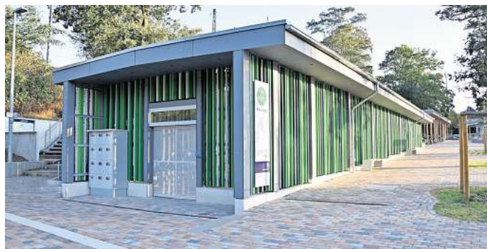
Immer noch nicht nutzbar: die Fahrradgarage am Bahnhof Großburgwedel.

Die Fahrradgarage als bauliches Herzstück der neuen Mobilstation, um das eigene Zweirad trocken und gesichert gegen Diebstähle abzustellen, ist im-