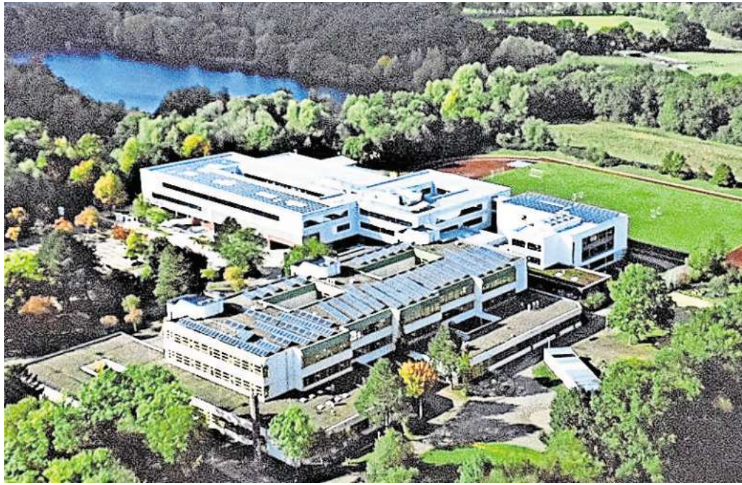
Eine der größten Investitionen der nächsten Jahre: Der Schulcampus Isernhagen soll mit einem Neubau erweitert werden.

Ebenso würden gesetzliche Rahmenbedingungen, etwa beim Vergabeverfahren oder beim Beantragen von Fördermitteln, immer komplexer werden und immense Ressourcen aufbrauchen. „Jeder Euro Fördergeld kostet uns 30 Cent“, beschrieb es der Bürgermeister mit