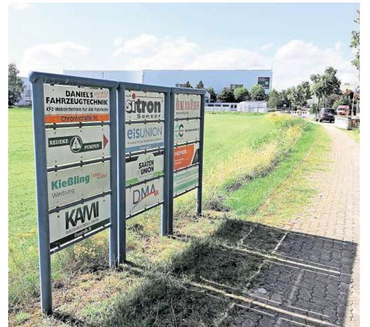
Mehr Flächen für Unternehmen: Isernhagen möchte in den nächsten Jahren neue Gewerbegebiete ausweisen. (Symbolbild)