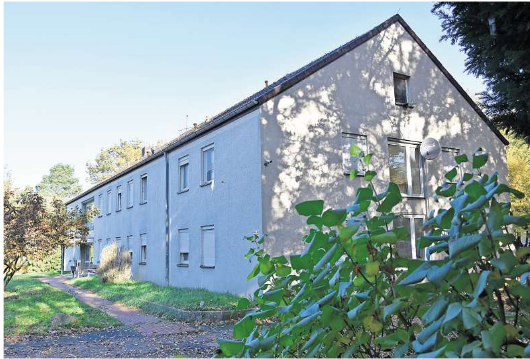
Eine der größeren Unterkünfte für Flüchtlinge: das ehemalige Schwesternwohnheim in Großburgwedel.

315 Geflüchtete leben derzeit aktuell in Unterkünften, die die Stadt selbst bereithält oder angemietet hat. Hinzu kommen 20 Menschen ohne festen Wohnsitz, die ebenfalls in den kommunalen Unterkünften ein Dach über dem Kopf bekommen. Besonders erfreulich seien die jüngsten Fortschritte