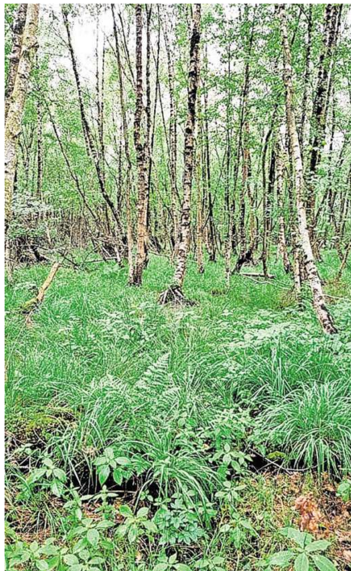
Schluss mit der Austrocknung: Das Altwarmbüchener Moor soll renaturiert werden.

Nur 116 Hektar des Altwarmbüchener Moores gehören dem Land. 62 Prozent sind Privatbesitz – verteilt auf 844 Eigentümer und 1291 Flurstücke. Etwa 100 Hektar werden von 25