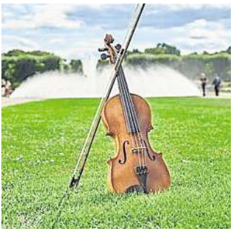
Barocke Spiele, Märchen und Musik sind in der „Sonntags“-Reihe im Garteneintritt enthalten.