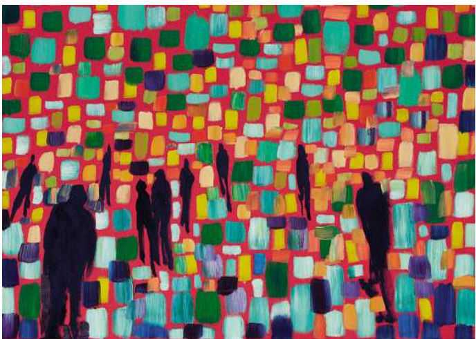
Andrea Neuman: „Dissolution - Grid Green“. Öl auf Leinwand, 2025.