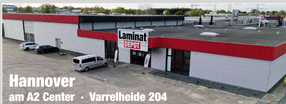
Hannover am A2 Center • Varrelheide 204

Laminat-Lager Mitte GmbH • Herforder Str. 158 • 33609 Bielefeld