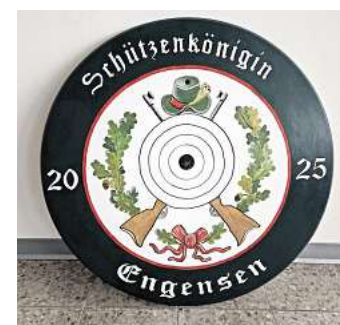
In Vorbereitung auf das Schützenfest beginnen bei der Schützengesellschaft Zentrum Engensen jetzt die Schießwettbewerbe.

Ein weiterer Höhepunkt ist der Wettbewerb „Der goldene Schuss“, an dem alle Mitglieder der Schützengesellschaft sowie alle Einwohner Engensens teilnehmen dürfen. Auch dieser Wettbewerb findet an den regulären Schießtagen statt. Der letzte Schießtag für alle Wettbewer-