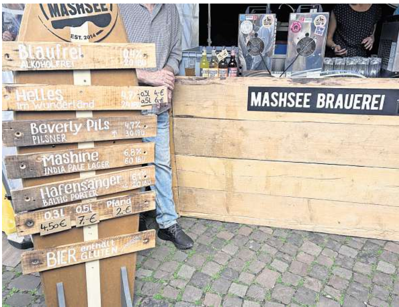
Von Hellem bis zum Baltic Porter: Auch die Brauerei Mashsee ist beim Hopfenfest dabei.

Der Verein wird für die Gäste des Hopfenfestes eine Parkfläche auf dem Schützenplatz an der Hagenstraße in K.B. einrichten. Kenzler weist darauf hin, dass Fahrzeuge lediglich auf dem befestigten Areal abgestellt werden sollen, um die Rasenflächen auf dem Platz zu schonen.