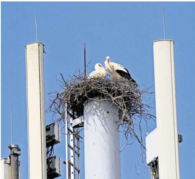
Brüten auf einem Antennenmast: In Neuwarmbüchen wurde ein Storchpaar auf einem ungewöhnlichen Nistplatz gesichtet.

Wie kommt es, dass sich die Tiere ausgerechnet dort ansiedeln? „Die Wahl solcher ungewöhnlichen Nistplätze ist sicherlich die Folge der in den letzten Jahren stark gestiegenen Storchpopulation“, sagt Bargsten. Für die nächste Saison soll der Horst jedoch umgesiedelt werden, damit die Funktionsfähigkeit des Senders nicht gefährdet wird.