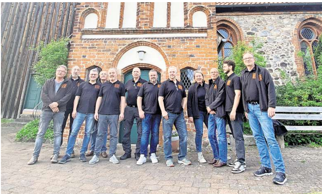
Geht in eine neue Runde: Die Organisatoren des Zehntfests auf dem Gelände der St.-Nikolai-Kirche haben das diesjährige Programm festgezurr.

Ab 19.30 Uhr startet dann auf dem Gelände vor dem Gemeindehaus an der Steller Straße die große Schlagerparty. DJ Andreas legt das Beste der Neuen Deutschen Welle sowie Schlager auf. Die Organisatoren hoffen, dass viele zum Feiern passend zum Motto in bunter Kleidung zur Party kommen. Das Ende des ersten Veranstal-