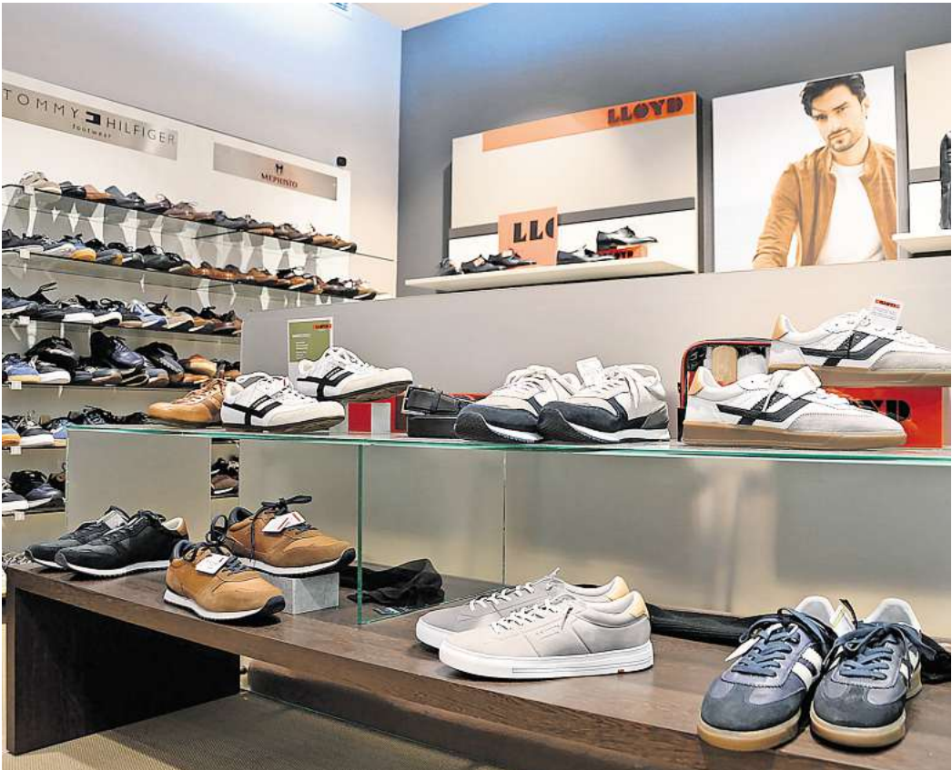
In der Herrenabteilung finden die Kunden unter anderem hochwertige Schuhe von Lloyd.

Für sommerliche Leichtigkeit sorgen im Alltag auch die so-