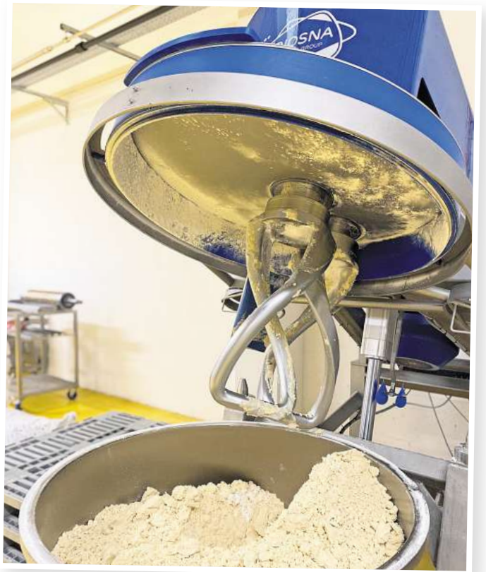
Der neue Standort in Peine verfügt über eine vollelektrische Backstraße. Mit modernen Maschinen stellt Parlasca spezielle Teigsorten her, unter anderem für Proteingebäck, Baby- und Kinderkekse sowie Bio-Produkte.