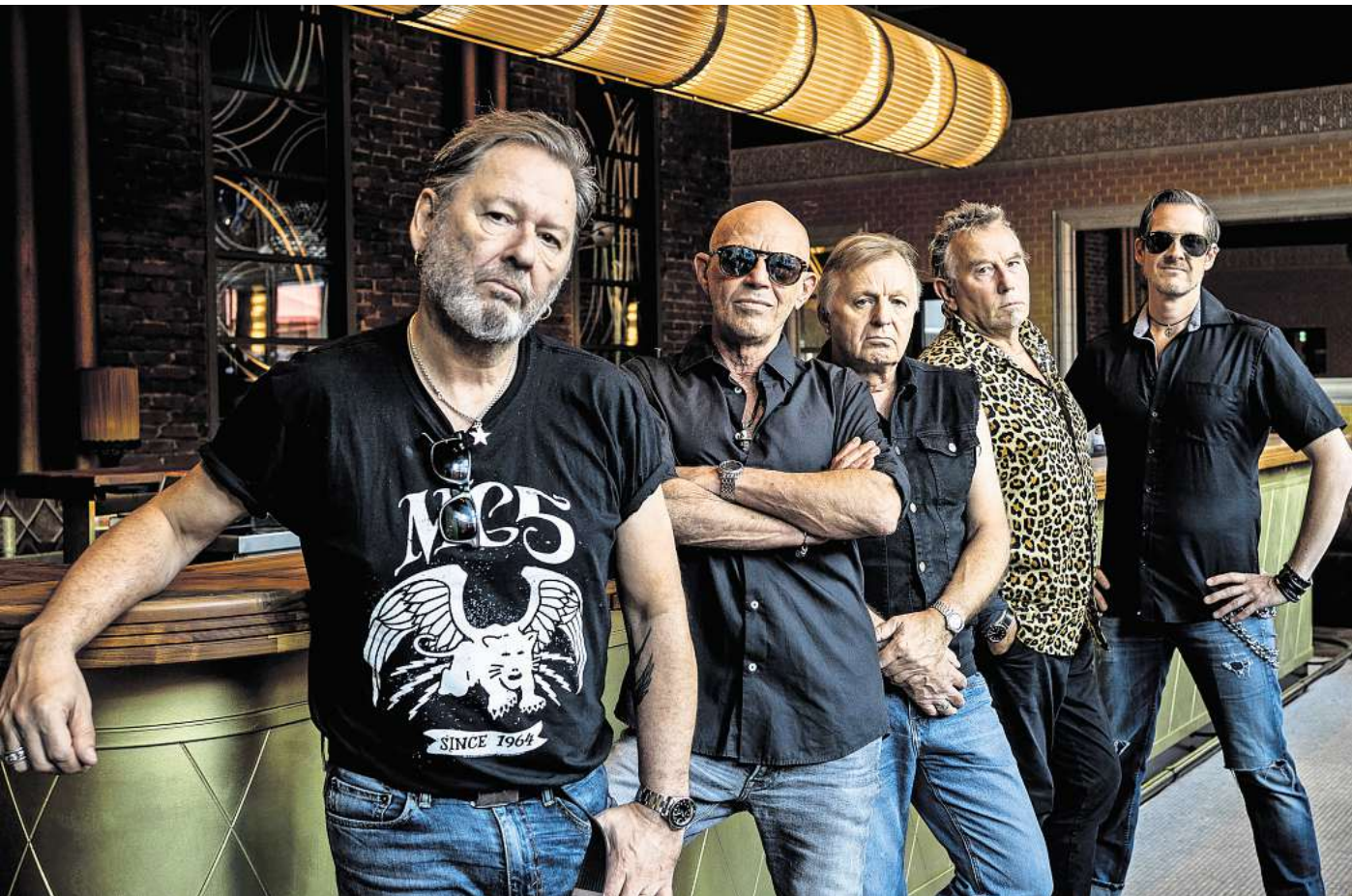
Sind in diesem Jahr der Headliner: Extrapreit spielen bei „Fuhrberg rockt“ im August 2025.