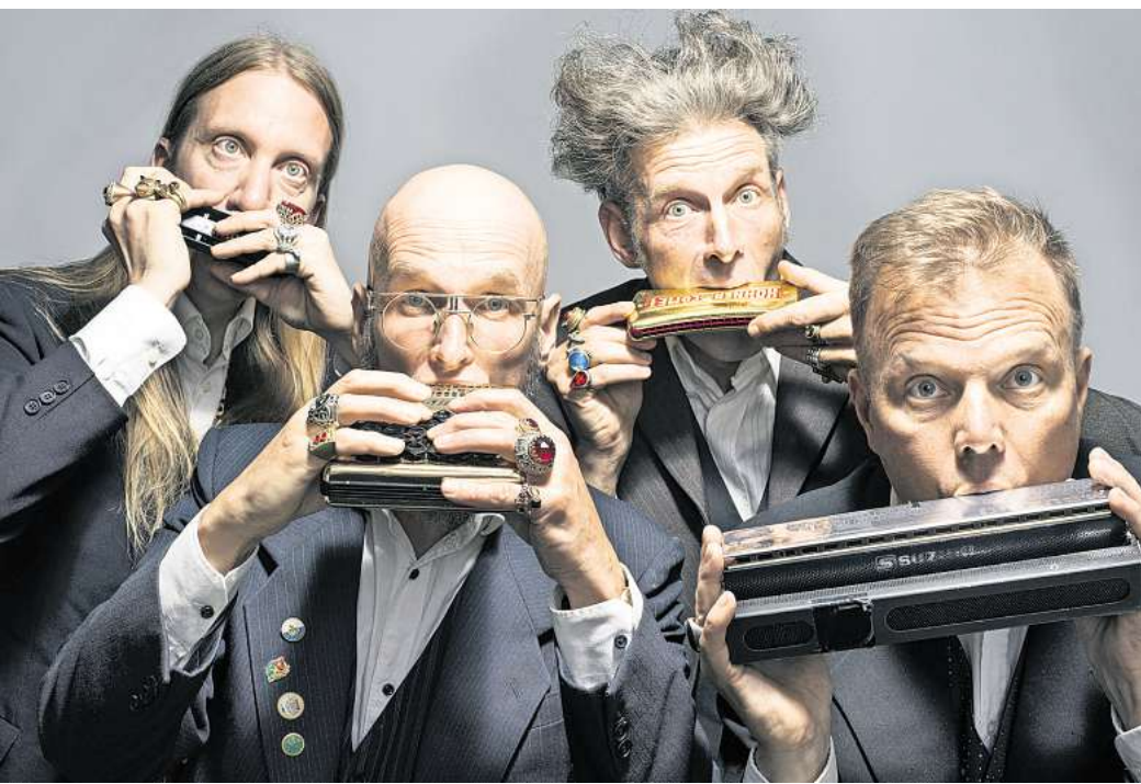
Das Quartett Sväng empfiehlt sich mit Musik und Humor.

Eintrittskarten sind im Vorverkauf in der Buchhandlung Böhrner erhältlich. Sollte es Restkarten geben, werden diese an der Abendkasse im Amtshof ab 19.30 Uhr verkauft. Konzertbeginn ist um 20 Uhr.