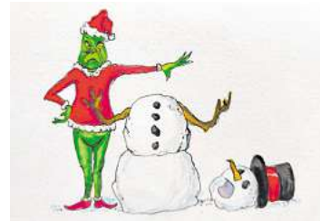
■ 3. Platz: Ingo Stein (Wedemark)