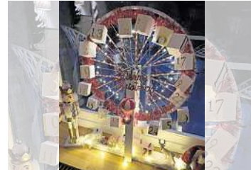
■ 1. Platz: Janina Gundelach (Hannover)