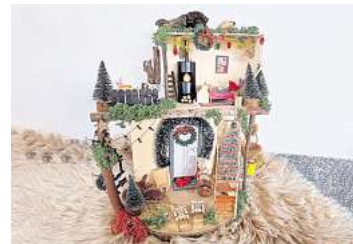
■ 2. Platz: Maja Hüters (Hemmingen)