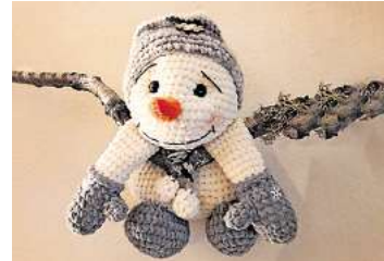
■ 1. Platz: Bettina Tegtmeier (Ronnenberg)