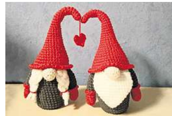
■ 2. Platz: Katharina Meine (Uetze)