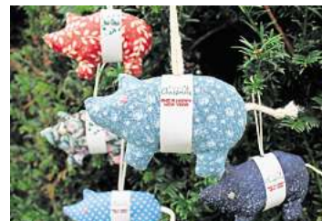
■ 3. Platz: Laura Eicke (Hemmingen)