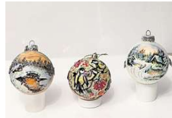
■ 2. Platz: Rimma Schilmover (Laatzen)