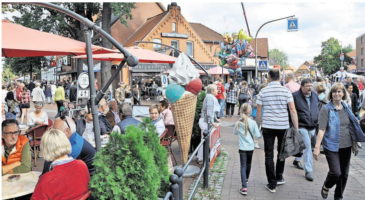
Wie bei den Stadtfesten: Diese Besucherfrequenz erhoffen sich die Organisatoren der Gewerbeschau mit verkaufsoffenem Sonntag im Juni in Großburgwedel.

IWU und IGK werben gemeinsam bei Geschäftsleuten für Teilnahme am Gewerbeschau-Wochenende im Juni