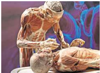
Ein Herzchirurg bei der OP.