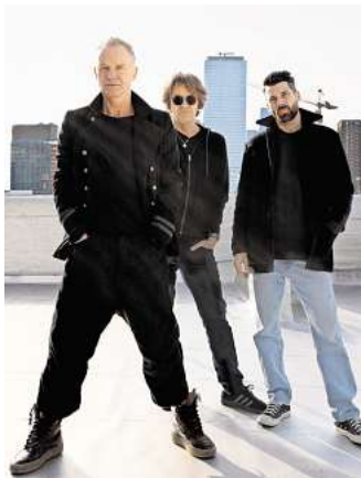
Sting präsentiert die größten Hits aus seiner Diskografie auf der Expo Plaza.

Ebenfalls kein Unbekannter ist Finnlands Musikikone Samu Haber. Als Frontmann von Sunrise Avenue hat Haber seit Anfang des Millenniums Millionen von Fans rund um den Globus begeistert – nun meldet sich der finnische Sänger und Songwriter in neuer Stärke zurück. Seit 2002 haben Sunrise Avenue immer wieder Publikumsrekorde gebrochen und waren mit allen veröffentlichten Singles und Alben über 1.263 Wochen in den offiziellen Charts in Deutschland, Österreich und der Schweiz vertreten – Tendenz weiter steigend. Heavy Rotation-Hits wie „Hollywood Hills“, „Fairytale (Gone Bad)“ oder „Heartbreak Century“ verbuchen momentan über 500k Airplay-Einsätze bei allen wichtigen nationalen Radiostationen. Mit seiner sympathischen Art entwickelte sich der Sänger und Musiker auch als Coach bei der populären TV-Show „The Voice Of Germany“ zum absoluten Publi-