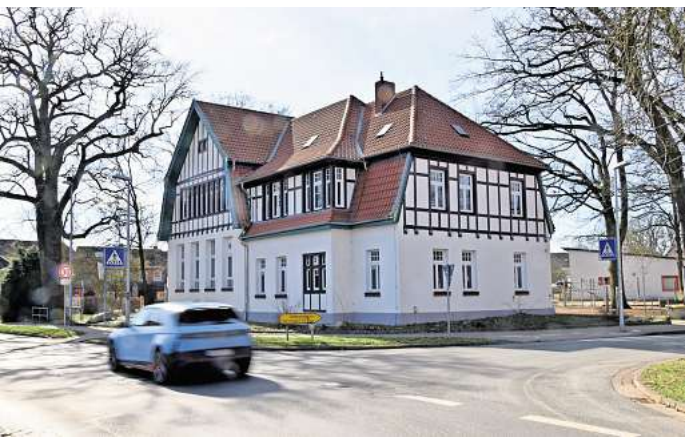
Erneute Verzögerung für den Ganztagsbetrieb an Isernhagener Grundschulen: An der Grundschule Drei Eichen in Neuwarmbüchen läuft vorerst die Hortbetreuung weiter.

Doch wie sollen die Schülerinnen und Schüler künftig nach dem Unterricht betreut werden? Schließlich wurde der Vertrag mit dem Träger des Hortes am Standort Kirchhorst zu Juli dieses