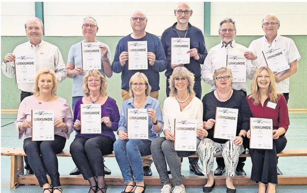
Mit Erfolg haben die Mitglieder der Tanzsparte des FC Neuarmbüchen das Deutsche Tanzsportabzeichen absolviert.

getanzt) bewertet. Ergänzt wurde die Veranstaltung von drei Tanzpaaren externer Tanzvereine. Diese sind vom TSC Gifhorn und dem TTC Gelb-Weiß im PSV Hannover angereist. Im Anschluss wurde der Erfolg mit einem kleinen Büfett und mit Getränken gefeiert, so dass die Akkus wieder aufgefüllt werden konnten. Über Zuwachs beim Tanzen würden sie sich sehr freuen. Nähere Infos auch unter www.fc-neuarmbuechen.de/tanzen.html