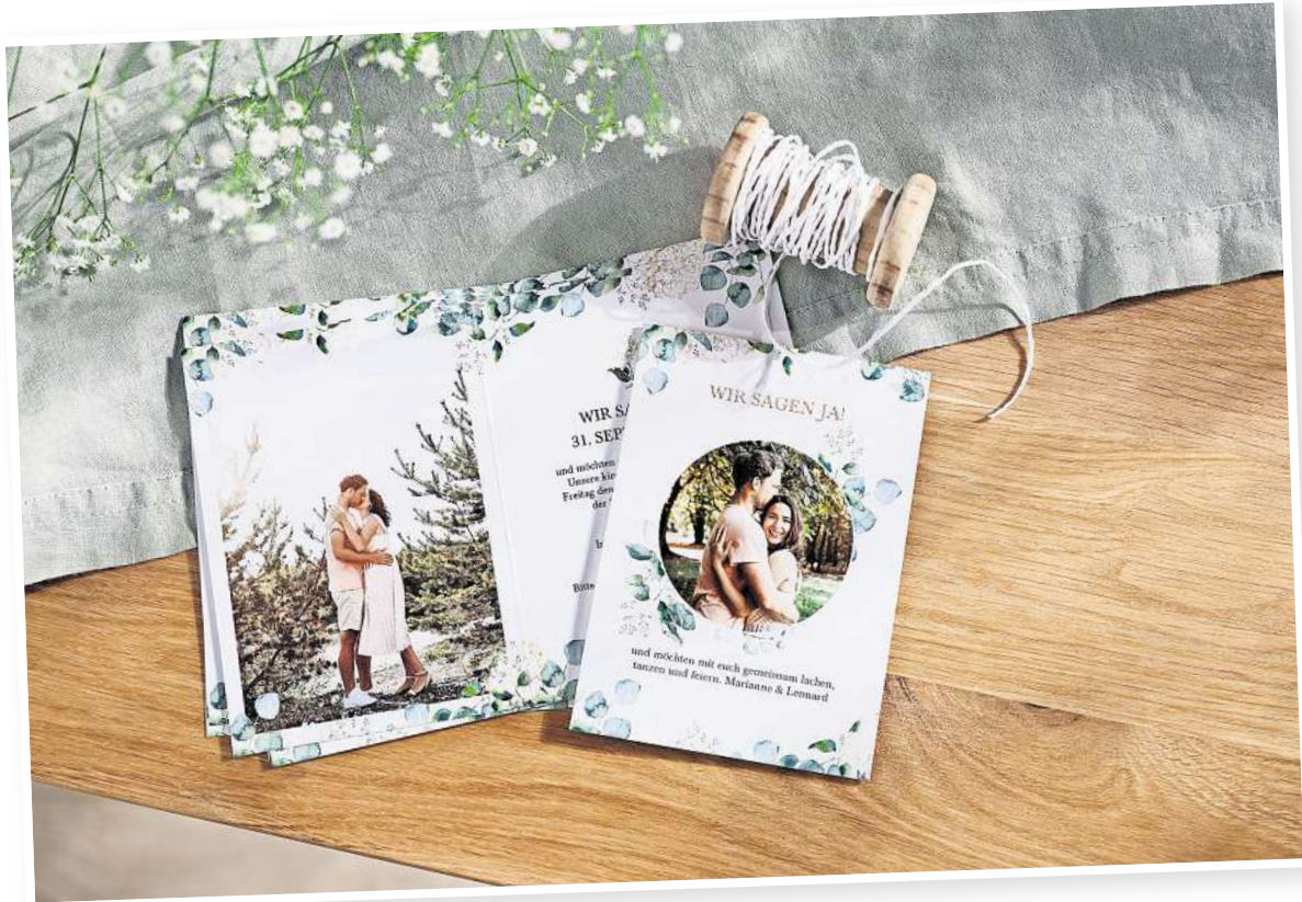
Hochwertige Papeterie für den schönsten Tag im Leben: Einladungskarten im individuellen Look wecken Vorfreude auf das große Fest.

Von der „Save the Date“-Karte über die Einladung bis hin zur Danksagung sorgt eine schöne Papeterie für den roten Faden und unterstreicht das Thema der Hochzeit. Kreativ gestaltete Tisch- und Menükarten, natürlich im selben Design, verschönern die Tischdekoration. Auch ein passendes Willkommensschild, Fototabellen oder ein individuell gestaltetes Gästebuch sind Extras für die Hochzeitpapeterie, die sich etwa unter www.cewe.de unkompliziert gestalten lassen. Wenn erst einmal feststeht, welcher Herzensmensch Trauzeugin oder Trauzeuge werden soll, überlegen Braut und Bräutigam: Wie kann ich die Person fragen und vielleicht mit einem persönlichen Geschenk überraschen? Eine ori-