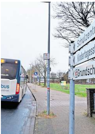
Einzige Zufahrt zum Schulzentrum: der Helleweg in Altwarmbüchen.

„Für die Kanalsanierungsmaßnahmen sind zum Teil Vollsperrungen einzelner Straßenabschnitte erforderlich“, teilt die Gemeinde mit. Dabei ist allen Beteiligten durchaus bewusst, dass der Helleweg die einzige Zufahrt zum Schulzentrum ist, auf dem sich IGS und Gymna-